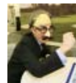
採用チーム&発表したSE3人