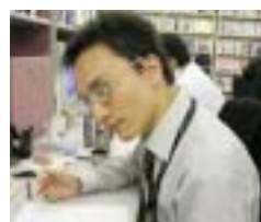
動物虐待の容疑です! By石塚