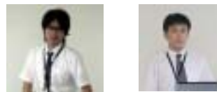
ナイスカメラ目線