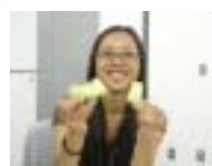
みずみずしいメロン

WANTED!! 社内潜入捜査!! 侵入者を 阻止せよ!! ~ File:13 ~