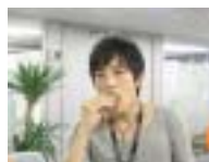
イケメン・メロン