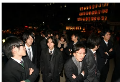
祈願待ちの行列に並び、アイロベックスの社員達