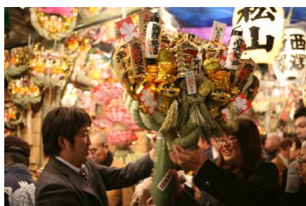
商売繁盛・巨大祈願熊手!!!