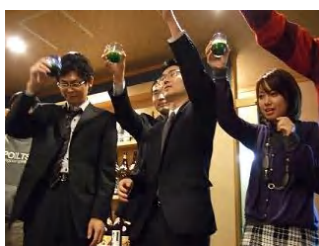
カンパニー!! お酒でなく、罰ゲームの青汁!!