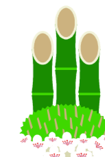
編集 ポール軽部 ジャッキー小原 玉木黒木

2007年は大変お世話になりました。 皆さんの良い習慣は見つかったでしょうか。 2008年もアイロベックスをどうぞ宜しくお願い申し上げます。