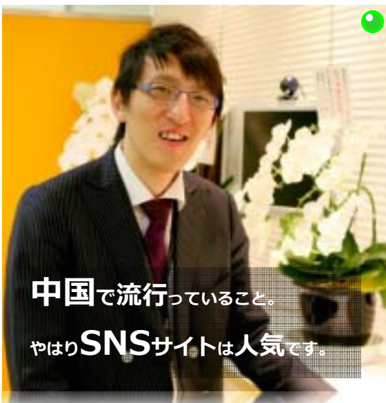
中国で流行っていること。

(※)開心農場とは 野菜を育てて収穫するゲーム。友人の農園で野菜が育ち、その野菜がまだ収穫されていない場合は盗むことができる。自分の農園で育った野菜を収穫していない場合は、友人から盗まれてしまう。yahooの農園ライフのようなものである。