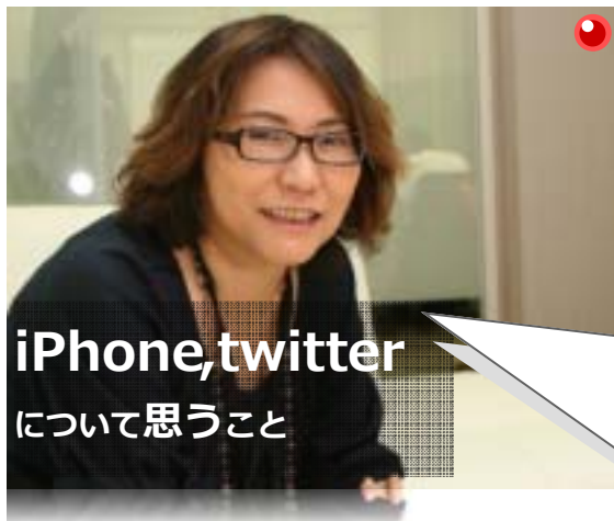
iPhone, twitter について思うこと