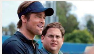
マネーボール Moneyball 2011年11月11日より丸の内ピカデリーほか全国にて公開 2011,アメリカ,SPE