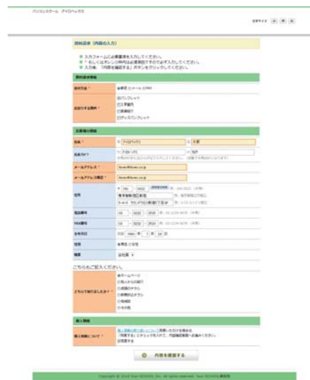
資料請求フォーム画面サンプル