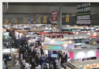
大勢のお客様でいっぱい会場