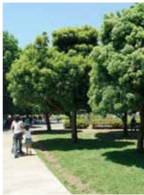
▲ 東京都立小金井公園