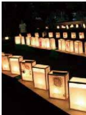
▲ グリーンロード灯り祭り