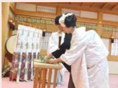
▲ 昔ながらの神前式です