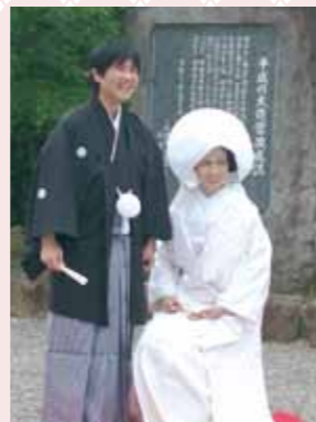
▲ 大神神社の儀式殿前にて

— おおおー!すごく繊細でかわいいですね!通信の表紙にさせていただきます!本当に結婚おめでとうございます!お幸せに!!