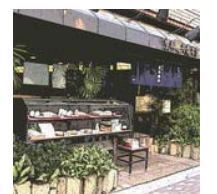
3) 総本家更科堀井 本店